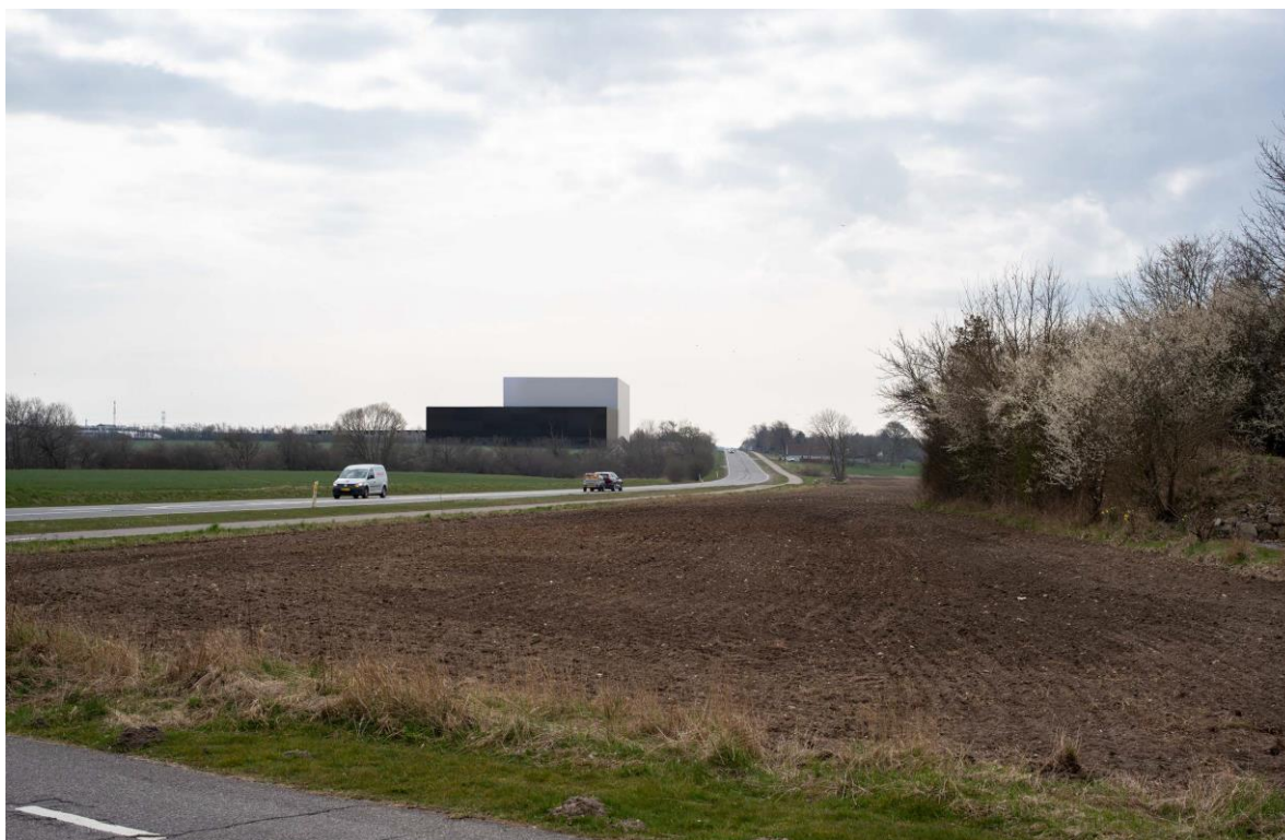
Figur 3. Visualisering af projektet set fra Vejlevej ved Syssebjergudkørslen