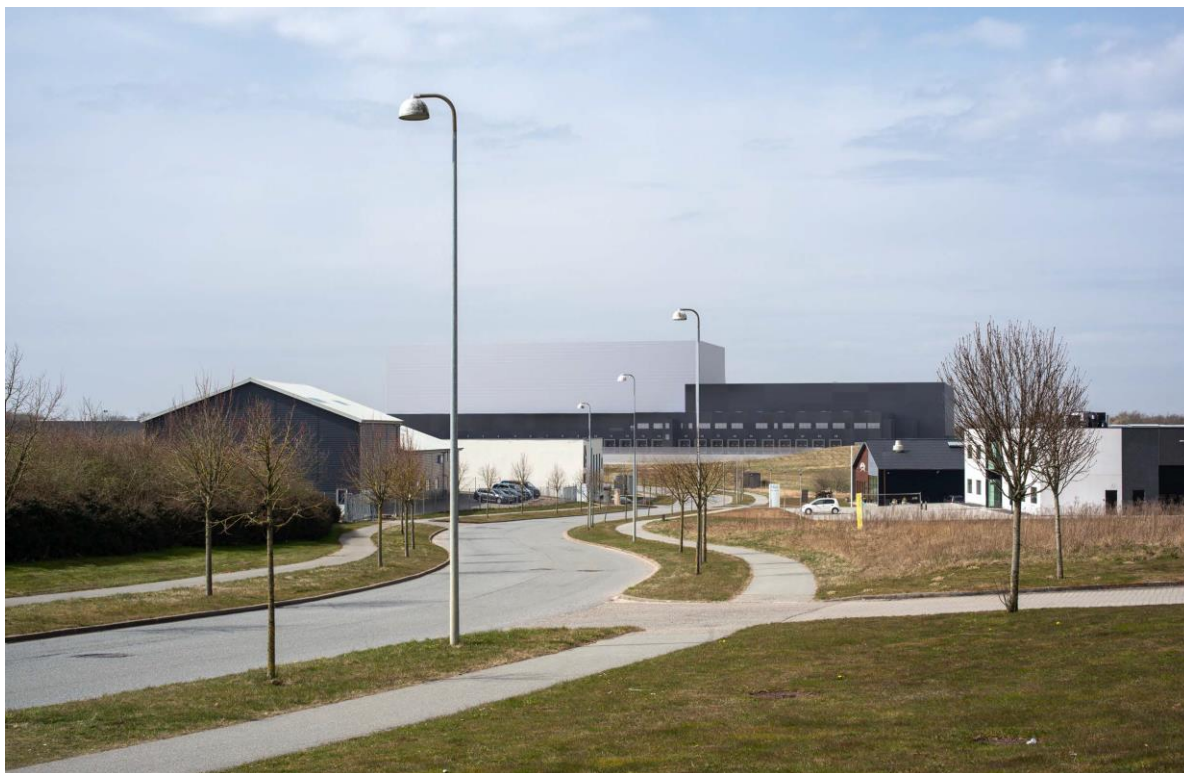
Figur 2. Visualisering af projektet set fra Nordager 19